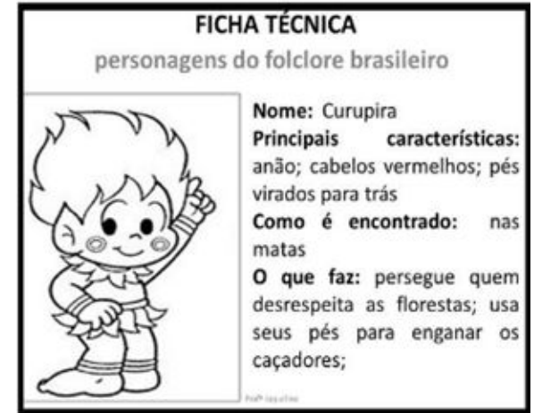
Atividade - Personagens Folclóricas