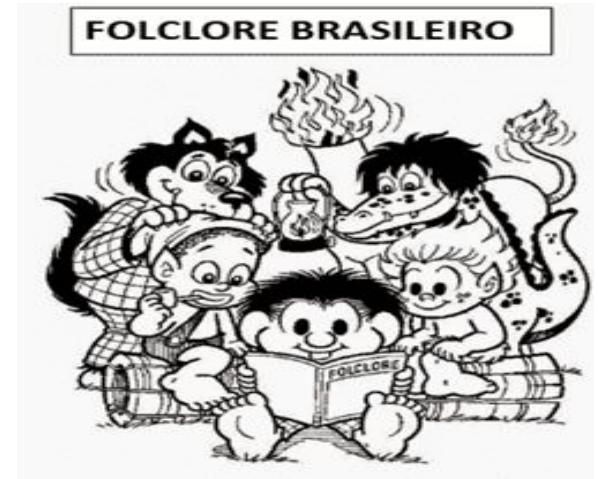
Personagens do Folclore