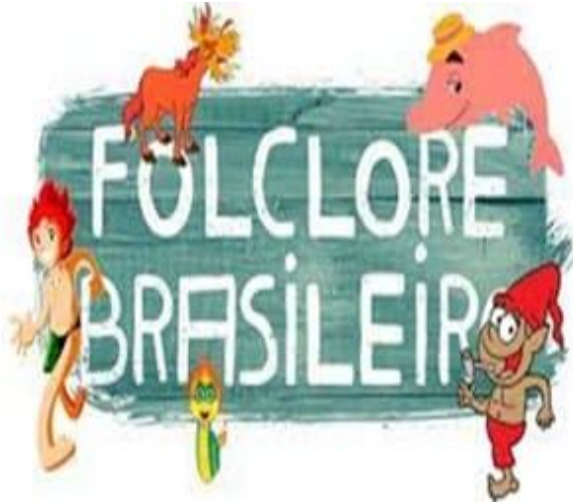
Atividade - Interpretação de Texto Folclore