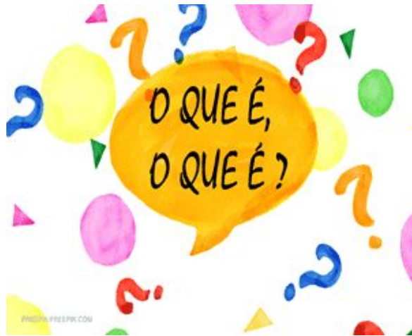
Atividade - Adivinhas Folclóricas