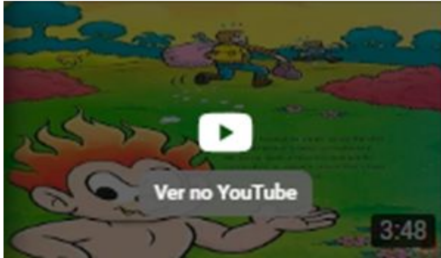
Lenda do Curupira O Guardião da Floresta