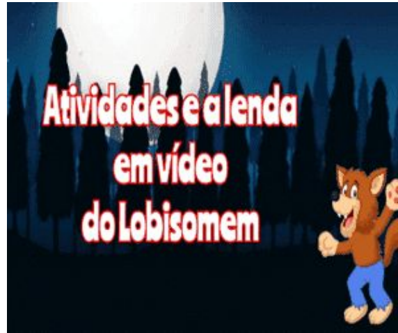
Lobisomem - Lenda em Vídeo