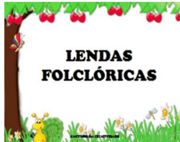
Atividade - Lendas Folclóricas