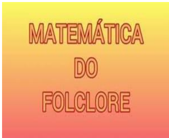
Atividade - Matemática do Folclore