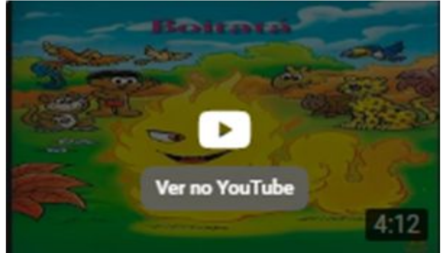
Lenda do Boitatá A Serpente de Fogo