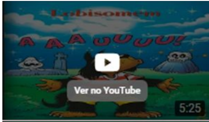
Lenda do Lobisomem