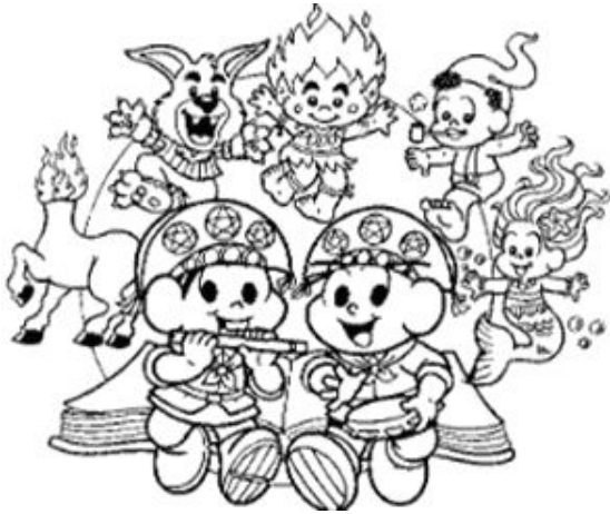
Atividade - 22 de Agosto Dia do Folclore