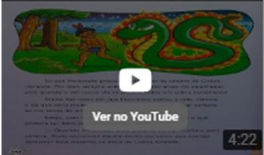
Lenda da Cobra Honorato