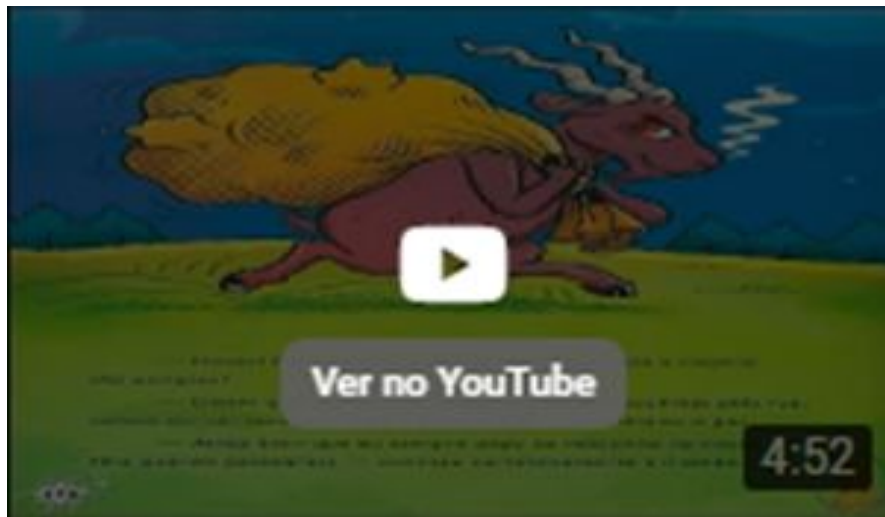
Lenda da Cabra Cabriola