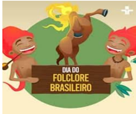
Atividade - Trabalho Texto Folclore