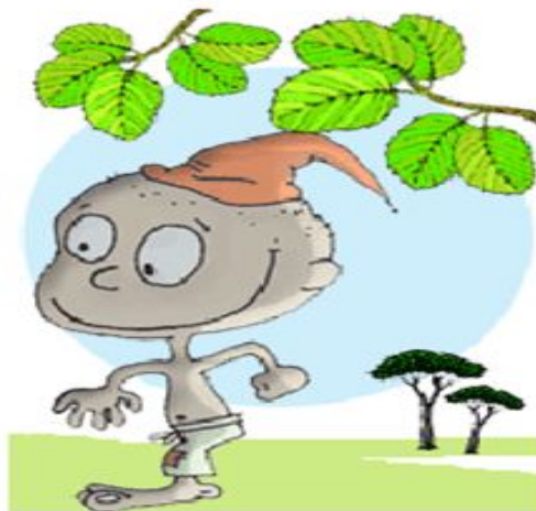
Atividade - Folclore Brasileiro