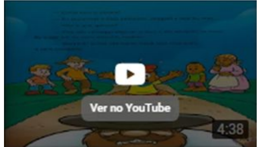
Lenda do Negrinho do Pastoreio