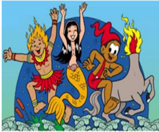
Apostila - Lendas do Folclore e Interpretação