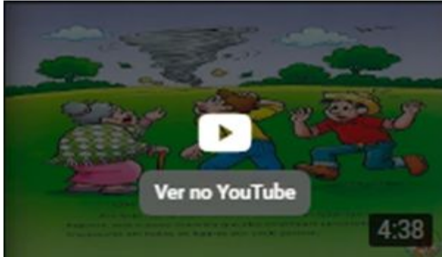
Lenda do Saci Pererê