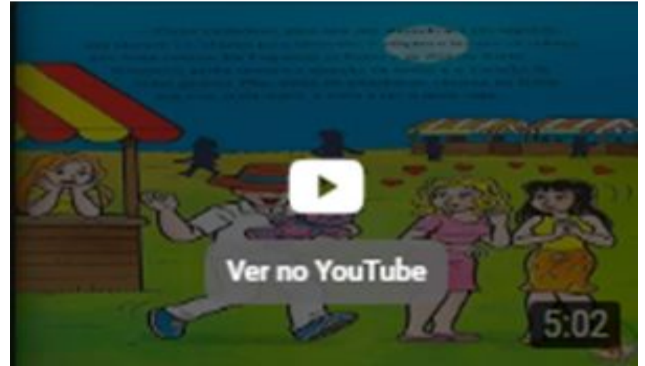
Lenda do Boto Cor De Rosa