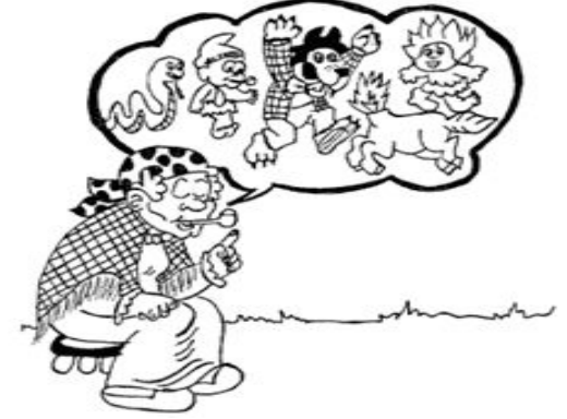
Atividade - Dia do Folclore