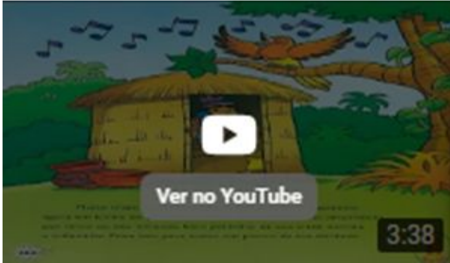
Lenda do Uirapuru O Pássaro da Felicidade