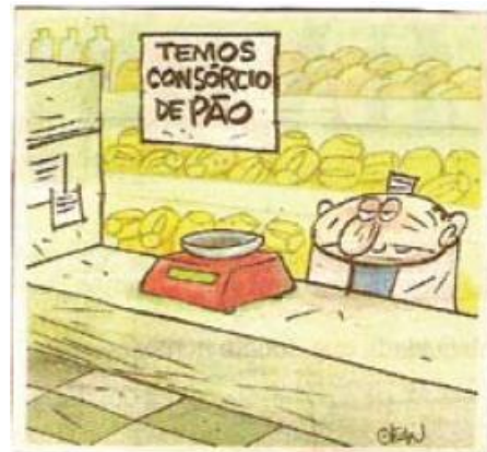
Folha de São Paulo, 26/04/2008 - Opinião. 50Língua Portuguesa Anos Finais do Ensino Fundamental - Prova Brasil

Na charge, o autor quer chamar atenção para: