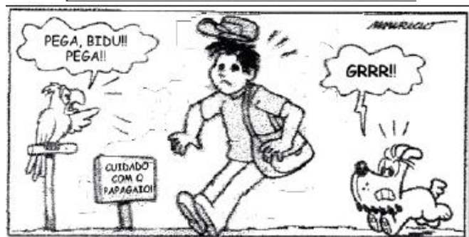
SOUSA. Mauricio de. Turma da Mônica. O Estado de S. Paulo , 4 abr. 2005. Caderno 2.