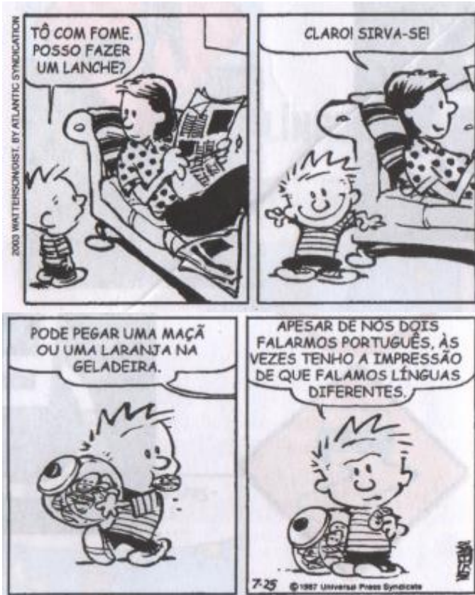
WATTERSON, Bill. O melhor de Calvin .