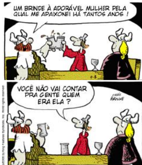
Hagar. Dik Browne.