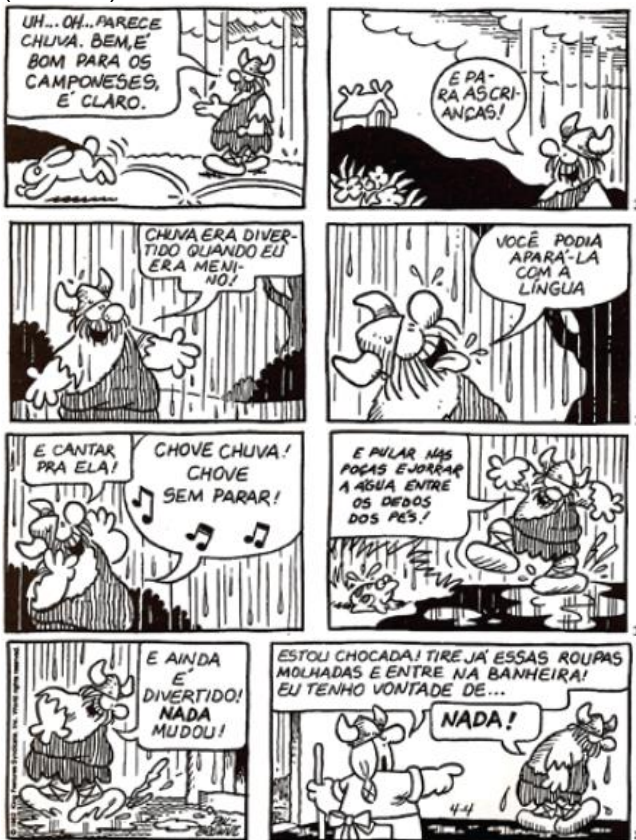
BROWNE, Dik. O melhor de Hagar o Horrível . Porto Alegre: LP&M, 2008, p. 24-25.