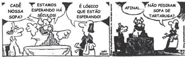
BROWNE, Dik. Hagar .