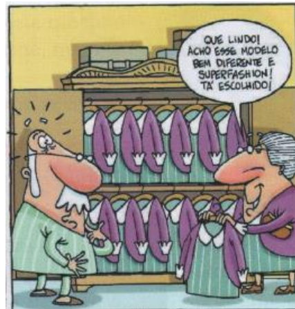
Adolar – Super –Vó. Em folha de S. Paulo, 13/9/2003.