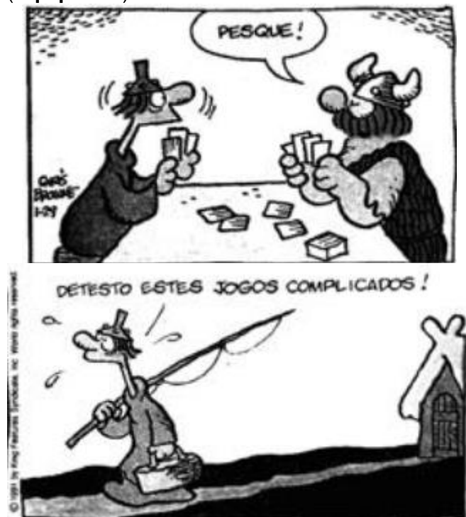
Dak. Browne. Hagar, o horrível. São Paulo: dealer, 1990, p. 15.