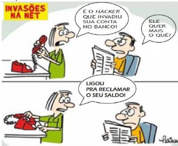
BOM DIA. Charge. 25 jan. 2011. Disponível em: http://bomdiariopreto.com.br/Charges/todas/5 . Acesso em: 17 set. 2011.

Nessa charge, o humor é criado pela (A) irritação da personagem vítima do golpe. (B) menção à qualidade dos serviços bancários. (C) falta de cuidado das pessoas com os crimes na internet.