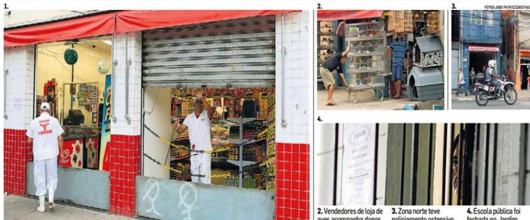
1. Comerciante baixa as portas de açougue, no Jardim Damasceno, após receber telefonema anônimo com ameaças