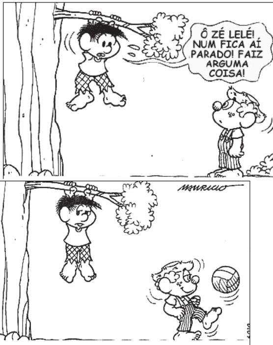
SOSA, Maurício de. Disponível em: < http://blogdosquadrinhos.blog.uol.com.br/arch2009-07-01_2009-07-31.html >. Acesso em: 29 dez. 2015.

cação é a arma mais poderosa que você pode usar para mudar o mundo. "Nelson Mandela"