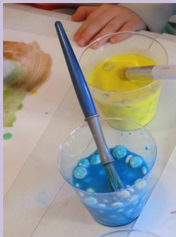
Pintura com M&M chocolate