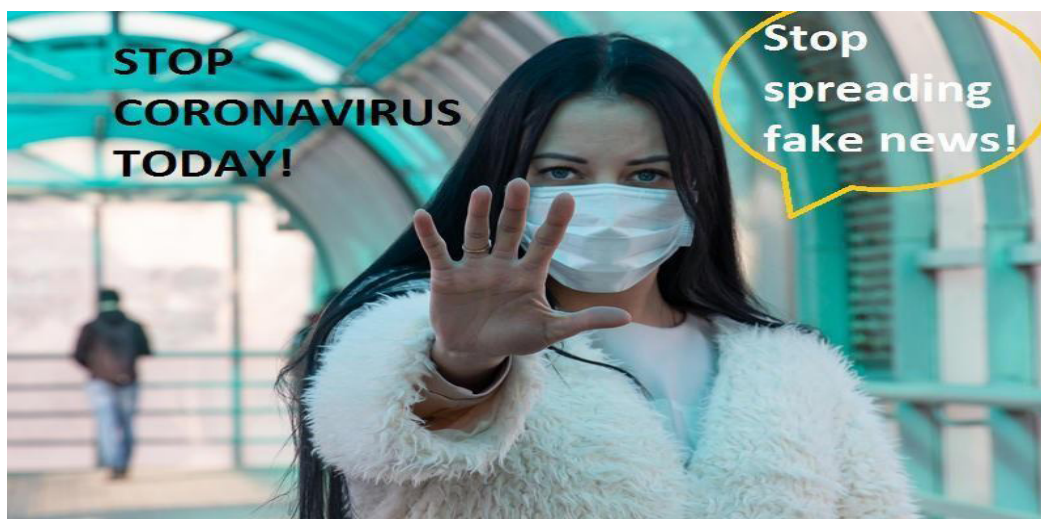
Foto: Wikimedia Commons/www.vperemen.com. Adaptado. Acesso em: 11 jan 2021.

To avoid fake news spreading, it's important to know the facts .