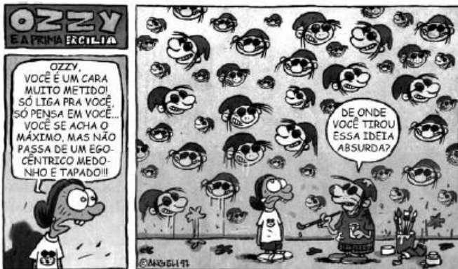
ANGELI. Ozzy. Folha de São Paulo, São Paulo, fev. 1997. Caderno Folhinha.

No segundo quadrinho, o que confirma o que a menina disse sobre Ozzy é a quantidade de