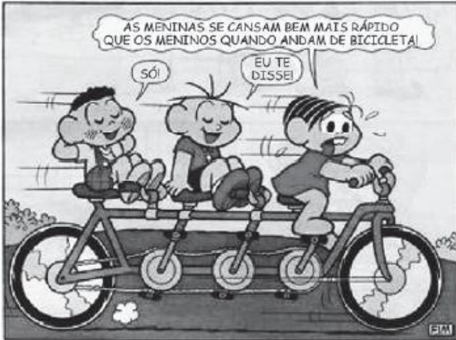
Turma da Mônica. Historinhas de uma página, n. 5, p. 57.

Nesse texto, a menina se cansou rápido porque