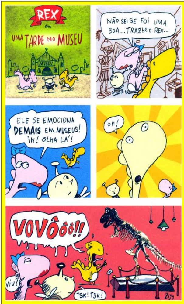
(Revista Ciência Hoje das Crianças. Ano 20/n. 177, Março 2007)

No segundo quadrinho, a personagem diz que não sabe se foi uma boa levar o Rex ao museu. Quem é o Rex?