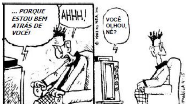
Jim Meddick. "Robô". In folha de São Paulo, 27/04/1993.

No 3º quadrinho, a expressão do personagem e sua fala "AHHH!" indica que ele ficou: