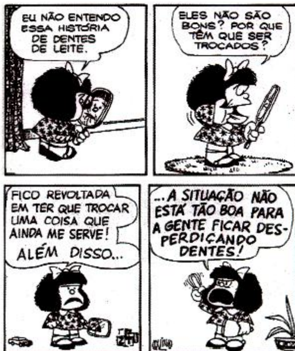
Toda Mafalda. Joaquim Salvador Lavado (Quino). São Paulo: Martins Fontes, 1993, p. 111.