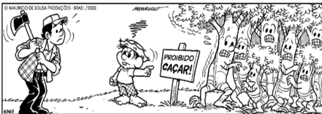
Copyright © 2000 Mauricio de Sousa Produções Ltda. Todos os direitos reservados. 6965

No quadrinho abaixo, as expressões das árvores indicam