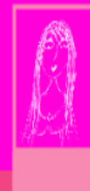
Suppa é a ilustradora