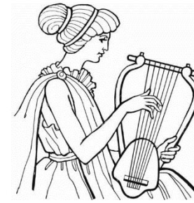
Lira – instrumento musical.

Manifestação artística com o fim de (re)construir os mundos real e ficcional, registrar e representar nossa cultura e nossa história.