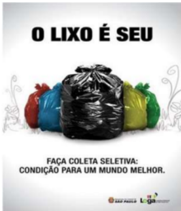
Imagem disponível em: https://www.tudosaladeaula.com/2016/11/atividade-de-interpretacao-de-anuncio.html . Acesso em 23 de maio de 2021.

Leia o anúncio para responder às atividades 14 e 15.